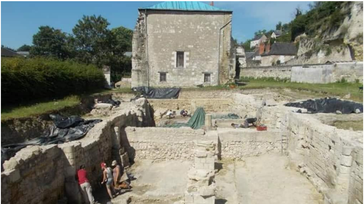
Le chantier de fouilles à Marmoutier

Analyse in situ sur les écrits de Rabelais à l'Arsenal avec la fluorescence X