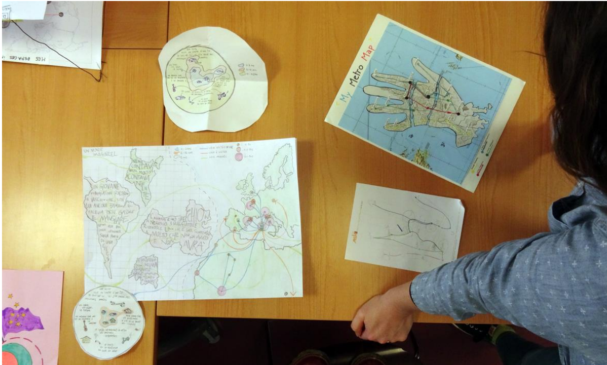
Deux exemples de réalisations lors de l'Atelier de cartographie expérimentale