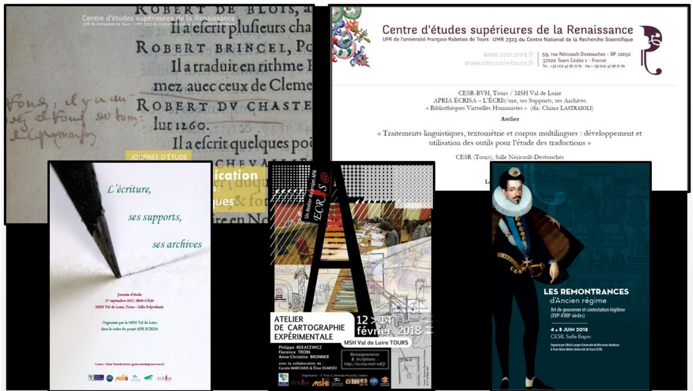
Les manifestations organisées par et/ou avec le soutien du projet ECRISA